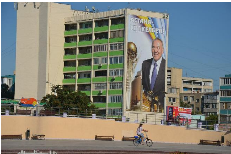
Fundacja Otwarty Dialog