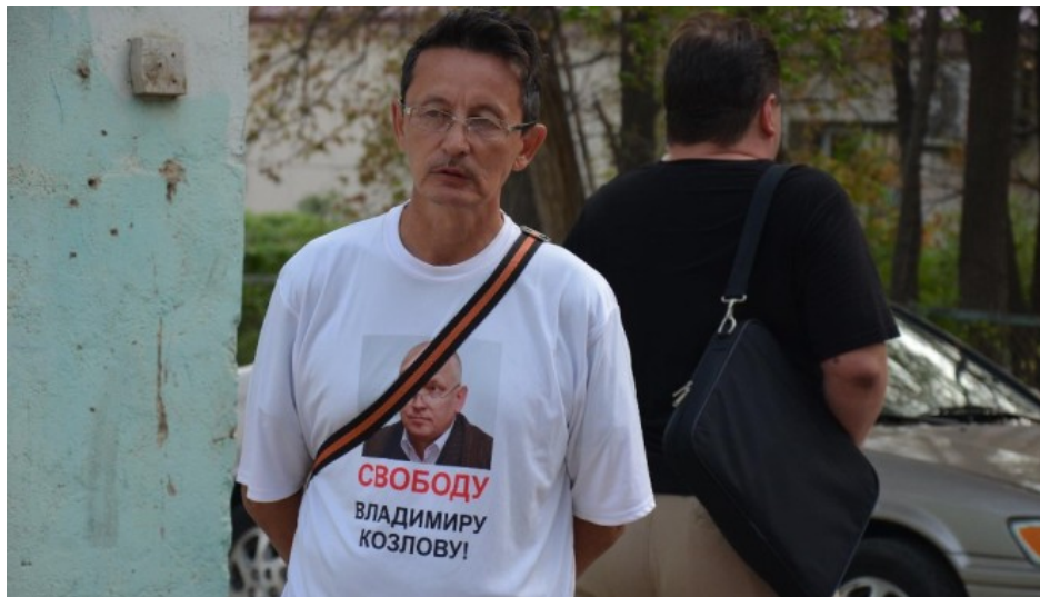
Fundacja Otwarty Dialog