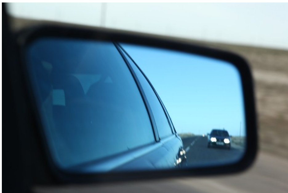
Fundacja Otwarty Dialog: samochody odbijające się w lusterku to funkcjonariusze śledzący ruchy obserwatorów procesu